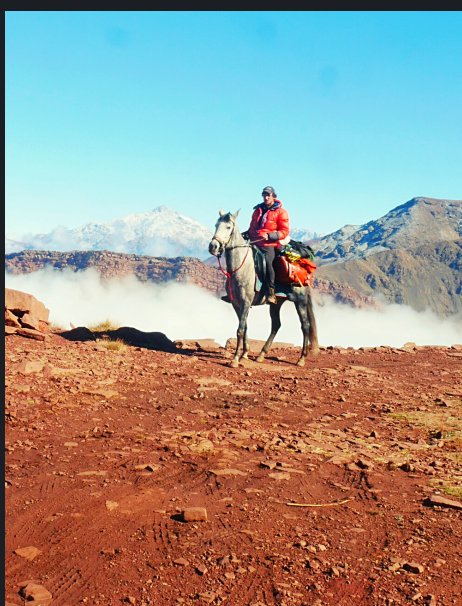
Le Haut-Atlas Marocain à cheval