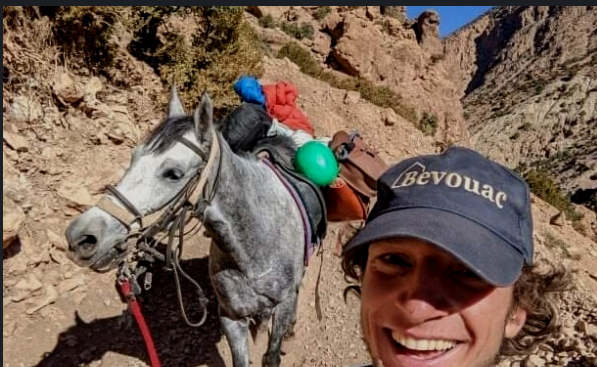
Traversée du Haut-Atlas Marocain à cheval