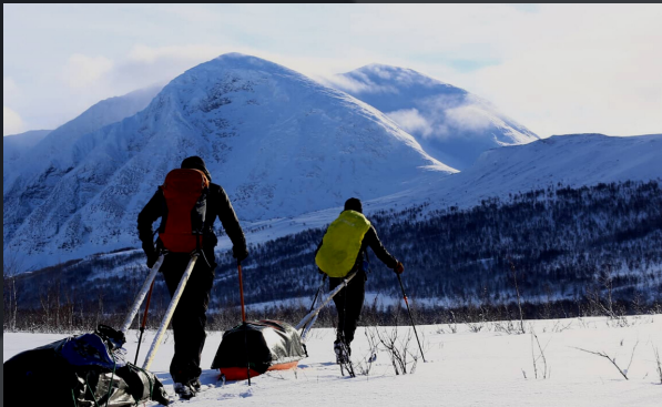
20 jours en autonomie dans le Sarek National Park (Suède)