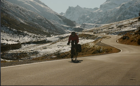
Lyon-Istanbul à vélo