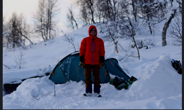
Ski de Randonnée en Suède