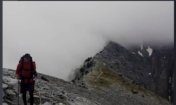
Trek de 30 jours entre La Macédoine, L'Albanie et la Grèce