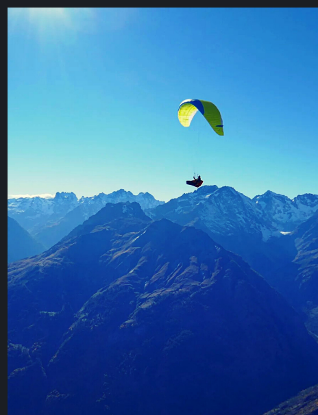
Traversée des alpes