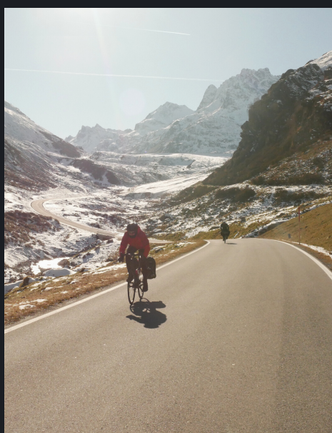
De Lyon à Istanbul