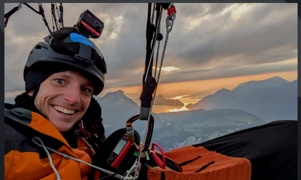
Traversée des Alpes en parapente Slovenie-Nice